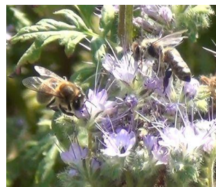
Pszczoła miodna na facelii.

Cennymi dla zapylaczy roślinami dziko rosnącymi są: wierzby, klony, lipy, jarzębiny, kruszyna pospolita, głogi, tarnina, berberys zwyczajny, malina, wawrzynek wilczełyko, wrzos zwyczajny, borówki, żurawina błotna, mącznica lekarska, nawłóć pospolita, macierzanka piaskowa, lebidka pospolita, wierzbowka kiprzyca, miodunka ćma, trędownik bulwiasty, pajęcznica gałęzista. Ponadto należy także mieć na uwadze następujące rośliny: komonicę zwyczajną, groszek