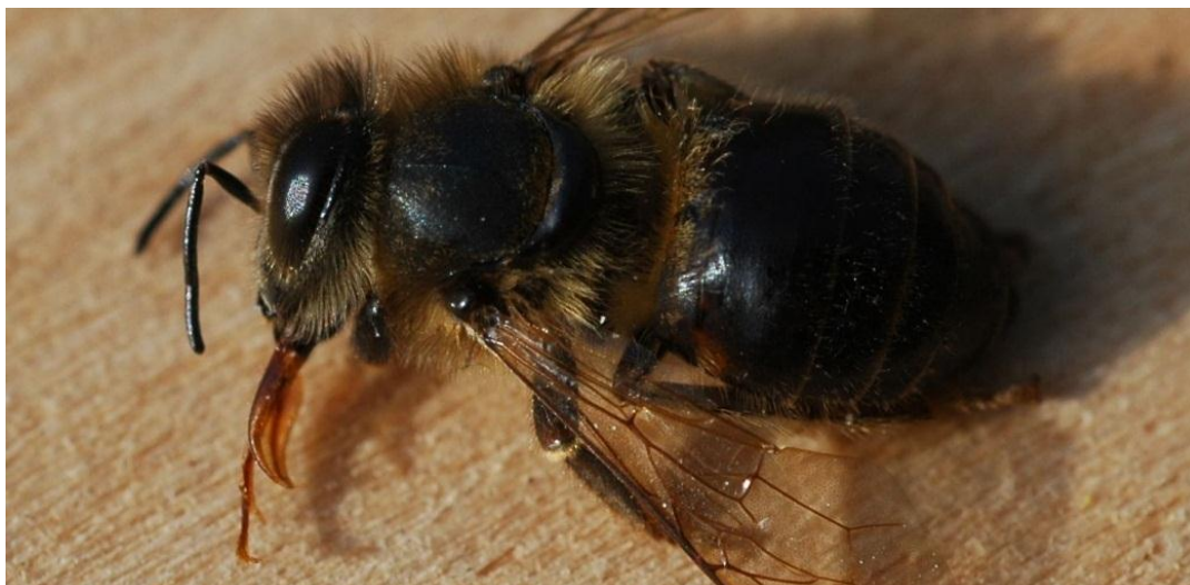
Pszczoła miodna zatruta chemicznym środkiem ochrony roślin z charakterystycznie wyciągniętym języczkiem.

Rozwój oraz masowe stosowanie chemicznych środków ochrony roślin miało miejsce po II Wojnie Światowej. Za początek tego okresu uznaje się rok 1946, w którym podjęto, na dużą skalę produkcję i stosowanie w ochronie roślin oraz higienie sanitarnej DDT. Początek stosowania na dużą skalę chemicznych środków ochrony roślin to początek szczególnie niebezpiecznych zatrucí pszczół.