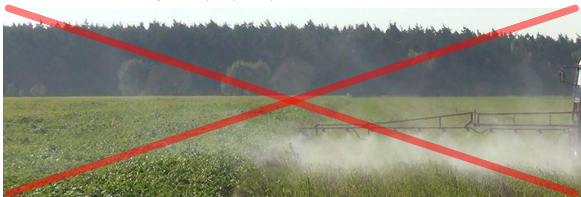
Znoszenie cieczy użytkowej stanowi zagrożenie dla zapylaczy na sąsiadujących plantacjach, na których pszczoły mają pożytek.