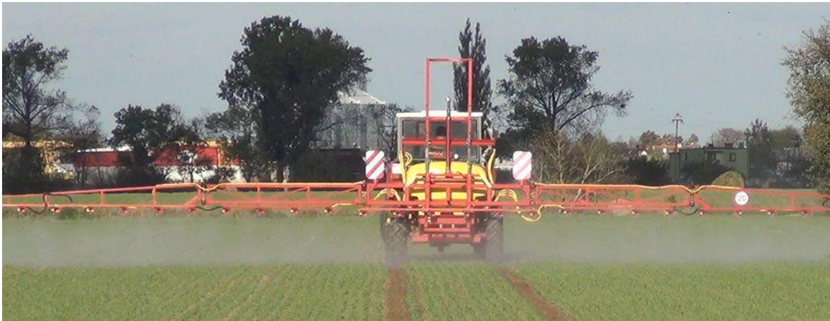
Opryskiwacz w trakcie pracy.

W Polsce liczba zatrutych pni pszczelich w ciągu ostatnich 50 lat uległa znacznemu zmniejszeniu. Mimo to zatrucia pszczoł środkami ochrony roślin są nadal zjawiskiem zbyt częstym. Przyczyną nie jest jednak sama chemiczna ochrona roślin czy brak warunkowań prawnych lecz błędy popełniane przez wykonawców zabiegów czy rolników, ich niedostateczne przygotowanie zawodowe oraz brak świadomości i wiedzy.