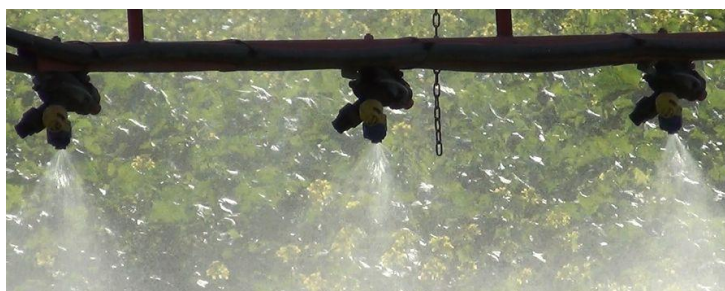
Sprawny technicznie opryskiwacz jest jednym z czynników warunkujących skuteczność i bezpieczeństwo zabiegu.

Zagadnieniem problematycznym jest łączne stosowania agrochemikaliów. Łączenia i łączne stosowanie środków, nie przebadanych w mieszaninach może być niebezpieczne dla zapylaczy. Podczas łączenia środków może dojść do dwóch różnych reakcji. Pierwsza to synergistyczne oddziaływanie komponentów mieszaniny. W wyniku takiej reakcji może ulec zmianie np. toksyczność dla pszczoł. Nawet łącząc dwa środki bezpieczne dla zapylaczy, o niskiej toksyczności dla pszczoły miodnej to w wyniku wzajemnych reakcji między tymi środkami może dojść do wytworzenia się mieszaniny charakteryzującej się wysoką toksycznością dla pszczoł. Drugi rodzaj reakcji to możliwość obopólnego znoszenia np. toksyczności dla szkodników. Obie reakcje mogą przebiegać w sposób nie kontrolowany a uzyskana mieszanina może charakteryzować się nieznanymi właściwościami ekotoksykologicznymi.