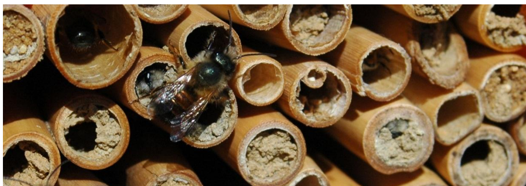
Hodowla murarki ogrodowej.

Ważnym aspektem wspierania dziko żyjących pszczół jest tworzenie korzystnych warunków dla bytowania, rozmnażania i gniazdowania tych owadów. Podstawowym elementem takich działań jest tworzenie w obrębie gospodarstwa tzw. użytków ekologicznych. Są to między innymi miedze, nieużytki, zadrzewienia śródpolne czy pasy zadrzewień a także kępy krzewów, roślinności niskiej oraz zbiorniki wodne znajdujące się wśród dziko rosnącej roślinności. Obecnie zaleca się aby powierzchnia użytków ekologicznych wynosiła od 5% do 7% całkowitej powierzchni gospodarstwa.