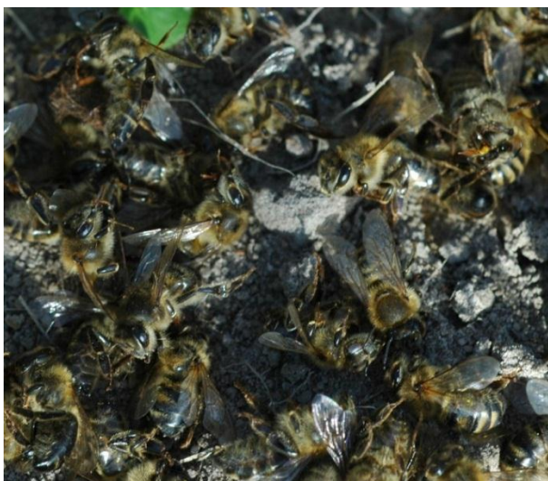
Martwe pszczoły przed ulem.

Najwięcej zatrucí zapylaczy obserwuje się w Polsce podczas kwitnienia rzepaku, szczególnie w okresie zwalczania słodyszka rzepakowego a także w sadach i na plantacjach ziemniaków i zbóż, na których prowadzi się zabiegi zwalczania w okresie kwitnienia chwastów. W przypadku obecności na plantacji kwitnących chwastów lub spadzi uprawę tą należy traktować jak uprawę kwitnącą.